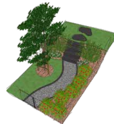
Plan du projet remis aux participants 10 jours avant l'épreuve. Ce plan est volontairement simple et les instructions vagues afin de mieux préparer les participants aux WorldSkills.

Ce prix est jugé indépendamment du concours proprement dit et n'a aucune influence sur son évaluation finale. Cependant, le jury du Meilleur Jeune Jardinier prend en compte dans sa notation les aspects liés à la sécurité au travail. L'évaluation de ce point et la remise de l'Award sont assurées par PreventAgri.